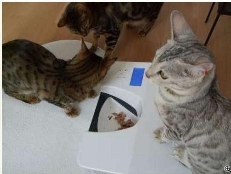
Der CATSOMAT in Aktion!

Köln. Geschäftsreisen, Urlaub oder ein Wochenendausflug? Dabei aber stellt sich die Frage: wohin mit dem geliebten Stubentiger, wenn man nicht zu Hause ist? Um diesem Umstand begegnen zu können, bedarf es intelligenter und bedarfsgerechter "Assistenten", die auch bei Abwesenheit die artgerechte, sichere und zuverlässige Versorgung der Vierbeiner übernehmen.